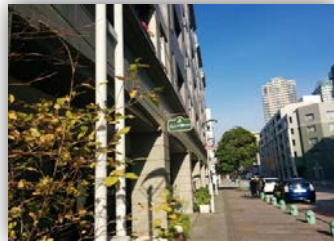
プロムナード沿いはとても便利