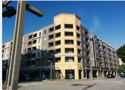
ペイタウンの中心に位置するパティオス6番街