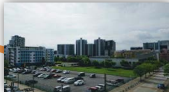
リビングからみる広がりのある景色