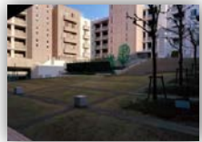
パティオは癒しの空間